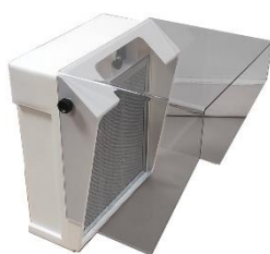
Petite visière VHI3PP