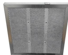
Filtre à charbon actif FCP1