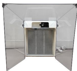
Grande visière VHI3GP