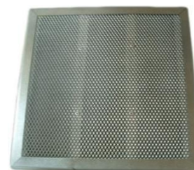
Filtro de carbón activo FCP1