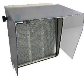
Faldón pequeño Para campana extractora tipo maleta HI3P