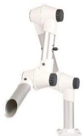
Brazo de aspiración TERFU75