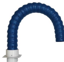
Brazo de aspiración segmentado modelo estándar