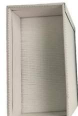
Filtre HEPA/Charbon actif FH6102