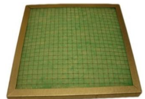
Filtre à poussières FPP1