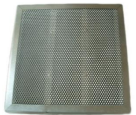
Filtre pour les acides FCP1-FT KOH