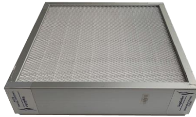
Filtre HEPA H14