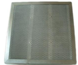
Filtre à charbon actif minéral FCP1 min