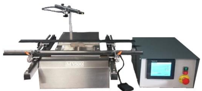
MV500 boîtier avec écran tactile