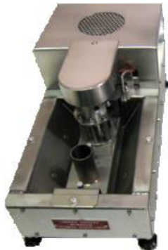
MV400 boîtier standard