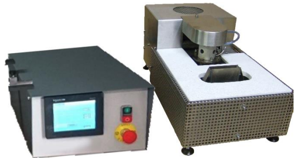
MV400 boîtier avec écran tactile