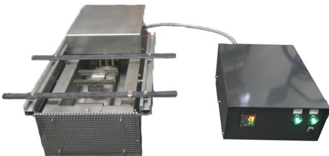
MV500 boîtier standard