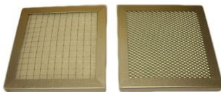
Filtre à poussières FA2