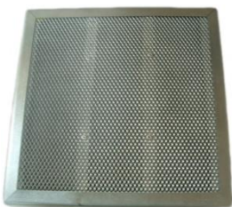
Filtre à charbon actif FCP1