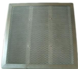
Filtro de carbón activo FCP1