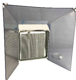
Grande visière VHI3GP