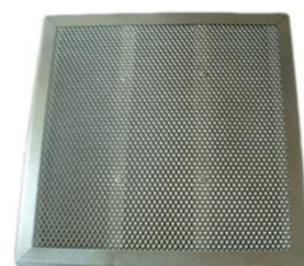
Filtre à charbon actif FCP1