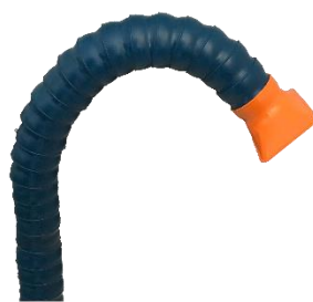
Bras d'aspiration à segments standard