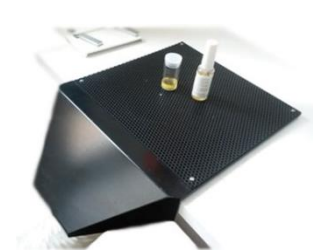
Platine aspirante AP2