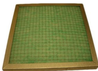
Filtre à poussières FPP1