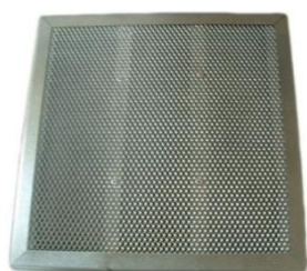
Filtre à charbon actif FCP1