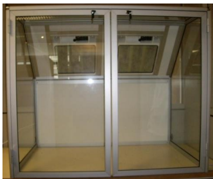
Option porte ouvrant à la française