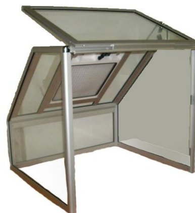
Option porte relevable