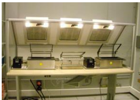
Cabine HI5VP triple