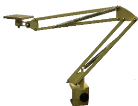
Bras articulé BH18