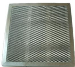
Filtre à charbon actif FCP1