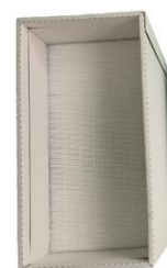
Filtre HEPA/Charbon actif FH6102