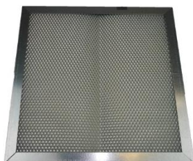
Filtre à particules FAP1