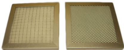
Filtre à poussières FA2