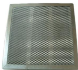
Filtre à charbon actif FCP1