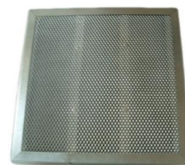
Filtre à charbon actif minéral FCP1 min