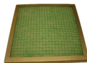
Filtre à poussières FPP1