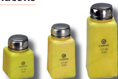
CT40ESD CT60ESD CT80ESD

- Flacons doseurs antistatiques pour solvants